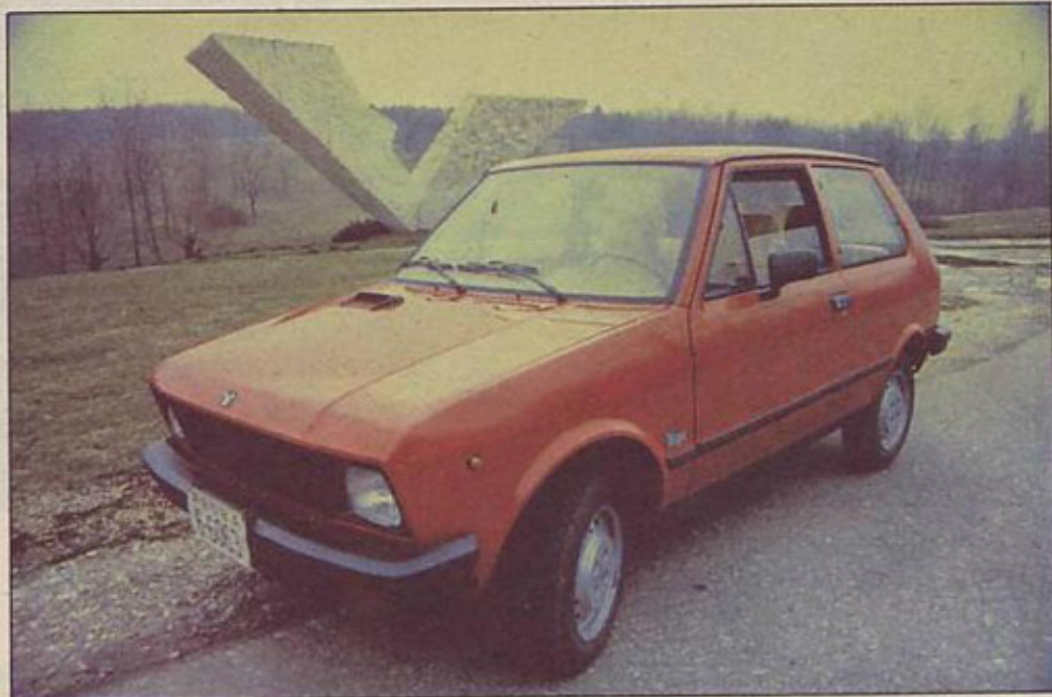
Jugo 45 A in 55 A

V Zavodih Crvena zastava tako rekoč s hitrostjo pete prestave osvajajo proizvodnjo juga za domači in tuji trg. Zaradi izvoza tega vozila v ZDA je bil jugo deležen naglih načrtovanih in nenačrtovanih sprememb. Od parol »Mali avtomobil za veliki svet« in »Novi model za novi svet« je nekaj kapnilo tudi domačim kupcem. Po vrsti izboljšav in sprememb se je jugo nekoliko le približal sistemu, kar nudijo uvozniki v tem razredu za devize. Govorimo o jugu 45 A in 55 A, ki sta bogatejše opremljena kot dosedanja vozila z oznako »luksuzna oprema«.